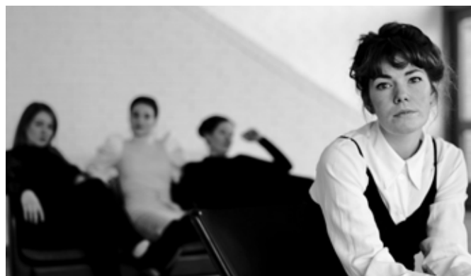
Saga Vokalensemble - LOVE FAIL.